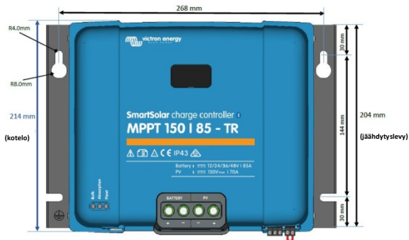
SmartSolar MPPT 150 I 85/100 - TR-mitat